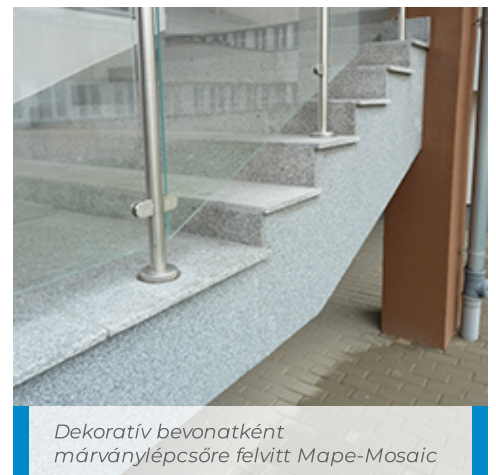
Dekoratív bevonatként márványlépcsőre felvitt Mape-Mosaic