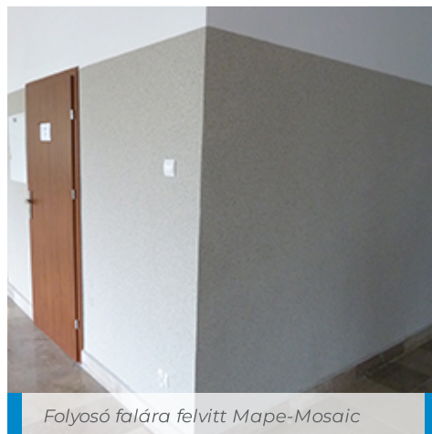
Folyosó falára felvitt Mape-Mosaic